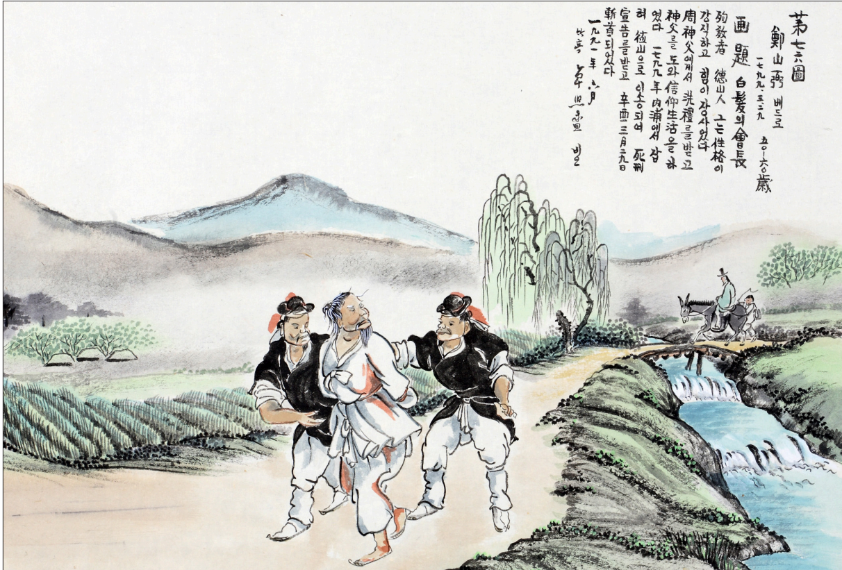
하느님의 종 124위 열전(12) - 정산필 베드로(?~1799년)

발행인 | 이병호 편집 | 천주교 전주교구 홍보국 제2150호 http://j catholic.or.kr E-mail | catholic114@hanmail.net 주소 | 560-110 전주시 완산구 기린대로 100번지 전화 | (063)230-1004 팩스 | (063)230-1175