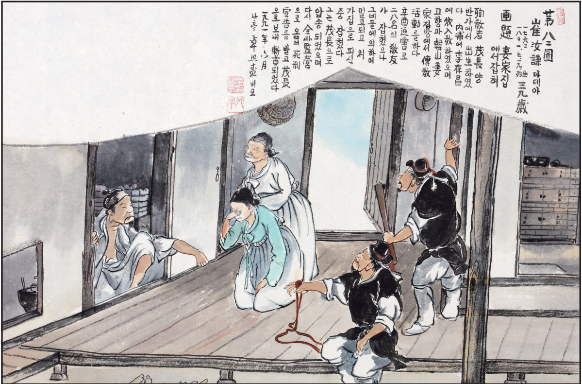
하느님의 종 124위 열전(50) - 최여겸 마티아(1763~1801)

발행인 | 이병호 편집 | 천주교 전주교구 홍보국 제2198호 http://catholic.or.kr E-mail | catholic14@hanmail.net 주소 | 560-110 전주시 완산구 기린대로 100 전화 | (063)230-1004 팩스 | (063)230-1175