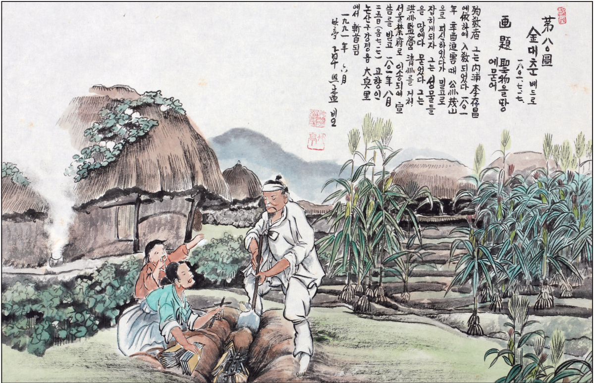
하느님의 종 124위 열전(47) - 김정득 베드로(?~1801년)

발행인 | 이병호 편집 | 천주교 전주교구 홍보국 제2193호 http://catholic.or.kr E-mail | catholic14@hanmail.net 주소 | 560-110 전주시 완산구 기린대로 100 전화 | (063)230-1004 팩스 | (063)230-1175