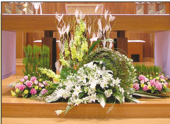
윤순정 바울라(교구 전례꽃꽂이연구회 회원)