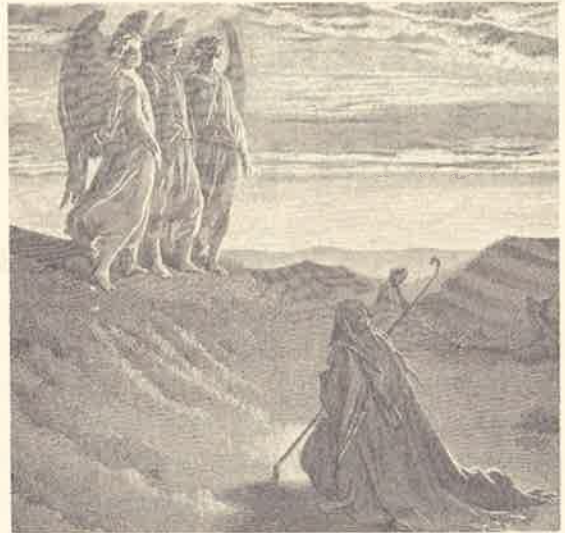
아브라함이 중재하는 모습

하느님의 계획이란 소돔과 고모라에서 들려오는 아우성을 직접 확인한 후, 사실임이 드러났을 때 그들을 벌하시려는 것이었다. 여기서 아우성이란 그 도시의 주민들이 저지르는 범죄를 거슬러 하느님의 정의에 호소하는 부르짖음을 뜻한다. 아벨의 피도 하느님의 정의에 호소하면서 땅에서 울부짖었다. 두 사람은 죄악상을 확인하러 소돔성에 내려가고 하느님만 아브라함과 함께 남는다. 이에 아브라함은 소돔과 고모라를 구하기 위해 하느님 앞에 중재자로 나선다. 아브라함의 간청하는 모습에서 한 집단의 멸망을 어떻게든 막아보려는 의인의 고충과 고운 심성을 엿볼 수 있다. 겸손과 신뢰에 가득 찬 그의 태도, 그러면서도 자신의 뜻을 솔직하게 직선적으로 전달하는 그의 탄원은 하느님으로 하여금 아무런 불쾌감 없이 끝까지 대화를 끌어갈 수 있도록 해준다.