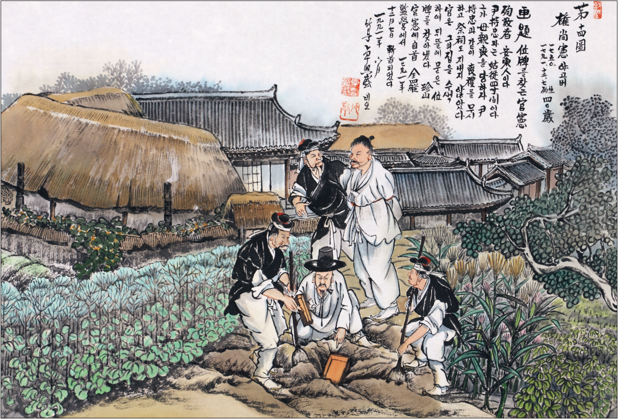
하느님의 종 124위 열전(3) - 권상연 야고보(1751-1791)