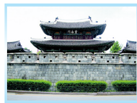
▶참수된 권상연 야고보의 목을 매달아 두었던 풍남문

위패를 찾는 관헌 권상연이 신주를 없애버렸다는 소식에 관헌들이 그의 집을 수색해 뒤뜰에 묻힌 위패를 찾고 있다.