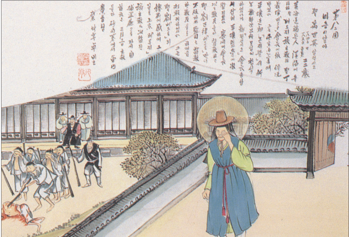
그림 | 탁희성 비오 · 글 | 김옥희 안나 수녀

발행인 | 이병호 편집 | 천주교 전주교구 홍보국 제2135호 http://j catholic.or.kr E-mail | catholic114@hanmail.net 주소 | 560-110 전주시 완산구 기린대로 100번지 전화 | (063)230-1004 팩스 | (063)230-1175