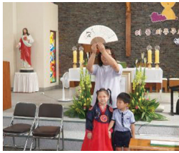
[기사제공 : 원평 성당]

신자들은 이동 신부님의 건강과 주님의 훌륭한 사제직을 수행할 수 있도록 기도하고, 정성껏 준비한 비빔밥으로 점심을 같이 먹으며 기쁨을 함께 나누었다.