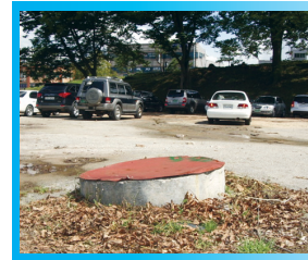
◀ 홍주 감옥터 (이 우물은 당시 옥터안에 있던 우물로 추정됨)

마지막 밥상 / 방 프란치스코가 사형수에게 주는 마지막 밥상을 받고 눈물을 흘리는 교우들을 격려하면서 기쁘게 식사를 하고 있다.