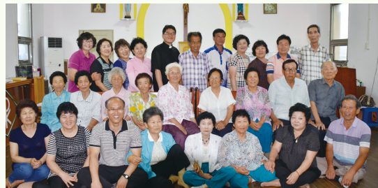
부안 마포 공소 신자들

이밖에도 아기자기한 시골 오수성당에의 웃음을 짓게하고 가슴 뭉클한 사연을 소개하며 '나는 정말 행복한 사람'이라고 고백하는 김종성 신부의 '사목 일기' 등 다양하게 꾸몄습니다. 떨어지는 낙엽을 보며 기도가 그리워지고 목상이 어울리는 이 계절에 <쌍백합>으로 사색하며 마음과 영혼을 살찌우시길 바랍니다.