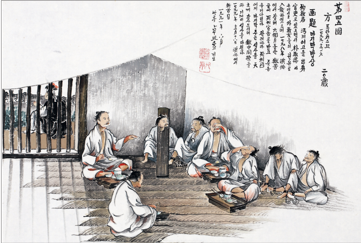
하느님의 종 124위 열전(9) - 방 프란치스코(?~1799년)

발행인 | 이병호 편집 | 천주교 전주교구 홍보국 제2146호 http://j catholic.or.kr E-mail | catholic114@hanmail.net 주소 | 560-110 전주시 완산구 기린대로 100번지 전화 | (063)230-1004 팩스 | (063)230-1175