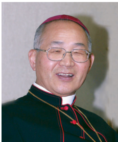
이병호 빈첸시오 주교 전주교구장