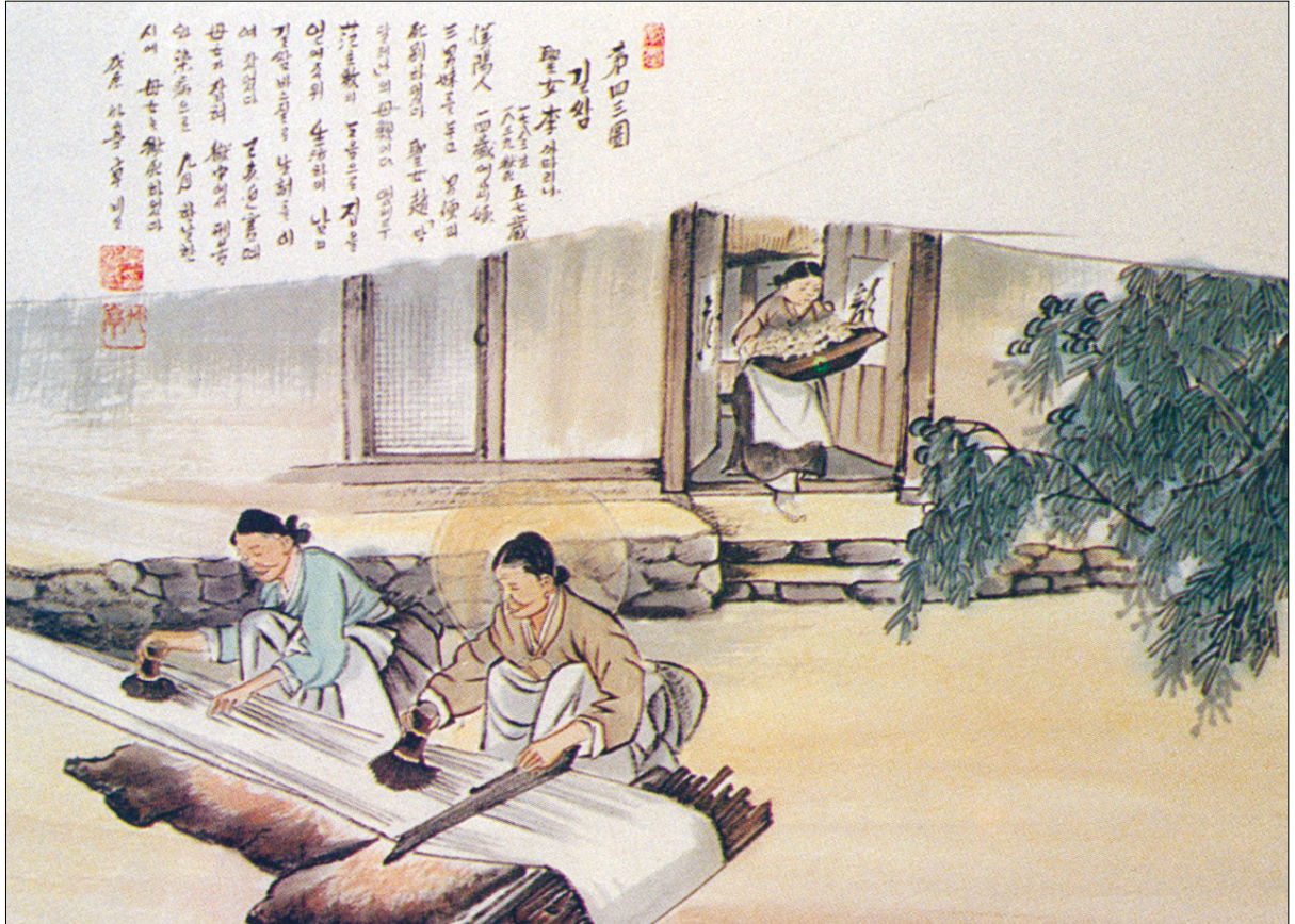
그림 | 탁희성 비오 · 그림 설명 | 김옥희 언나 수녀

발행인 | 이병호 편집 | 전주교 전주교구 홍보국 제 2099호 http://jcatholic.or.kr E-mail | catholic114@hanmail.net 주소 | 560-110 전주시 완산구 기린대로 100번지 전화 | (063)230-1004 팩스 | (063)230-1175