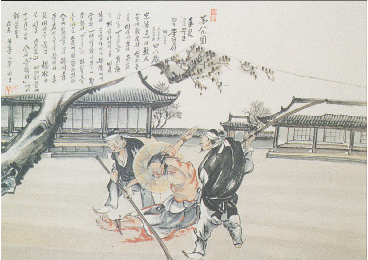
그림 | 탁희성 비오 작

발행인 | 이병호 편집 | 전주교 전주교구 홍보국 제 2061호 http://j.catholic.or.kr E-mail | catholic114@hanmail.net 주소 | 560-110 전주시 완산구 기린대로 100번지 전화 | (063)230-1004 팩스 | (063)230-1175