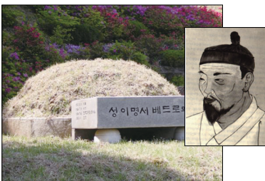
<전호성지 성 이명서 베드로 묘>

수족을 묶고 / 성인은 중병에 걸려 교우들이 피신하라고 권유하였으나 피신하지 않고 있다가 체포되었다. 포교는 성인의 수족을 묶고 곤장으로 쳤으나 끝내 배교하지 않았다.