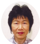
육금선 마르셀리나 이중 성당

수요일 오후, 저에겐 일주일 중에 가장 기다려지는 시간입니다. 갓 지어낸 밥처럼 따끈따끈한 숲정이가 인쇄소에서 도착하여 처음으로 받아들일 수 있는 시간이기 때문입니다. 한 장, 한 장을 펼쳐넘길 때마다 주님께서 풍성한 사랑으로