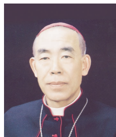
박정일 미카엘 주교 前 전주 교구장

'숲정이' 2000호 발간을 진심으로 축하드립니다. 아울러 40년 가까이 매주 '숲정이'를 펴내기 위해 수고하신 수많은 분들의 노고를 치하하여 감사를 드립니다. 이 글을 쓰면서 짧지 않은 7년 동안 전주교구에 몸담았었고 '숲정이'와 함께한 것을 회상하며 새삼 긍지를 느끼는 바입니다.