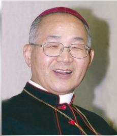
이병호 빈첸시오 주교 전주 교구장

‘숲정’이 지령 2000호를 기록하게 되었다니 새삼스런 느낌이 먼저 듭니다. ‘숲정’은 간단한 소식지로서 교구의 크고 작은 일을 반영하는 거울이었고, 그런 만큼 되돌아보면 지나온 발자취가 그대로 거기 찍혀 있습니다. 특히 암울했던 군사 독재 시절을 보내면서 우리가 올바른 길을 모색하고 정의를 지키기 위해서 얼마나 애썼는지를 간단하게나마 알 수 있습니다.