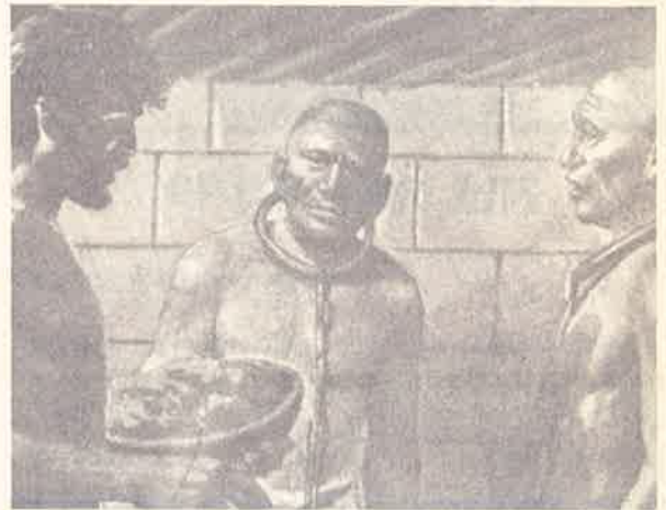
옥중의 요셉 : 요셉은 두 죄수, 즉 왕의 술잔 시종과 빵 굽는 시종의 꿈을 해몽해 주었다.

사흘 후 파라오는 자신의 생일을 맞아 큰 잔치를 벌이는데 두 시종장을 불러내어 술잔을 시종들던 시종장은 복직시키고, 빵을 만드는 시종장은 처형한다. 요셉의 예언대로 이루어진 것이다. 그런데 술잔 시종장은 당신이 복직될 때 감옥에서 벗어나게 해달라던 요셉의 부탁을 까마득하게 잊어버린다. 이 마지막 기록은 다음 이야기 때 술잔 시종장의