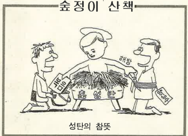
숲 정 이 산책

“알렐루야. 거룩한 날이 우리를 위해 밝았으니, 만백성들이 와서 주님께 예배드리세. 오늘 큰 빛이 세상에 내리셨도다.”