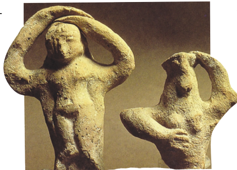
애도하는 여인들 부장품으로 사용된 듯한 이 애도하는 여인의 점토 입상들은 기원전 7세기의 것으로, 오늘날의 이스라엘 아조르에서 발굴되었다.

애가의 저술 시기와 장소에 대해서도 단정적으로 말하기 어렵다. 하지만 이 노래들이 전부 바빌론 제국이 예루살렘을 함락한 기원전 587년 이후에 저작되었다는 데에는 대부분의 학자들이 동의한다. 저술 장소로는 이스라엘 백성들의 유배지인 바빌론이 고려되기도 하지만, 이 노래들이 시작하는 것처럼 예루살렘으로 생각하는 것이 타당할 것이다 (2,9,10; 4,22; 5,4,8,18).