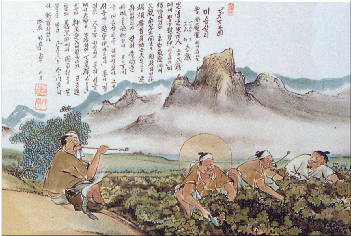
그림 | 탁희성 비오 · 글 | 김옥희 안나 수녀

발행인 | 이병호 편집 | 천주교 전주교구 홍보국 제 2093호 http://j catholic.or.kr E-mail | catholic114@hanmail.net 주소 | 560-110 전주시 완산구 기린대로 100번지 전화 | (063)230-1004 팩스 | (063)230-1175