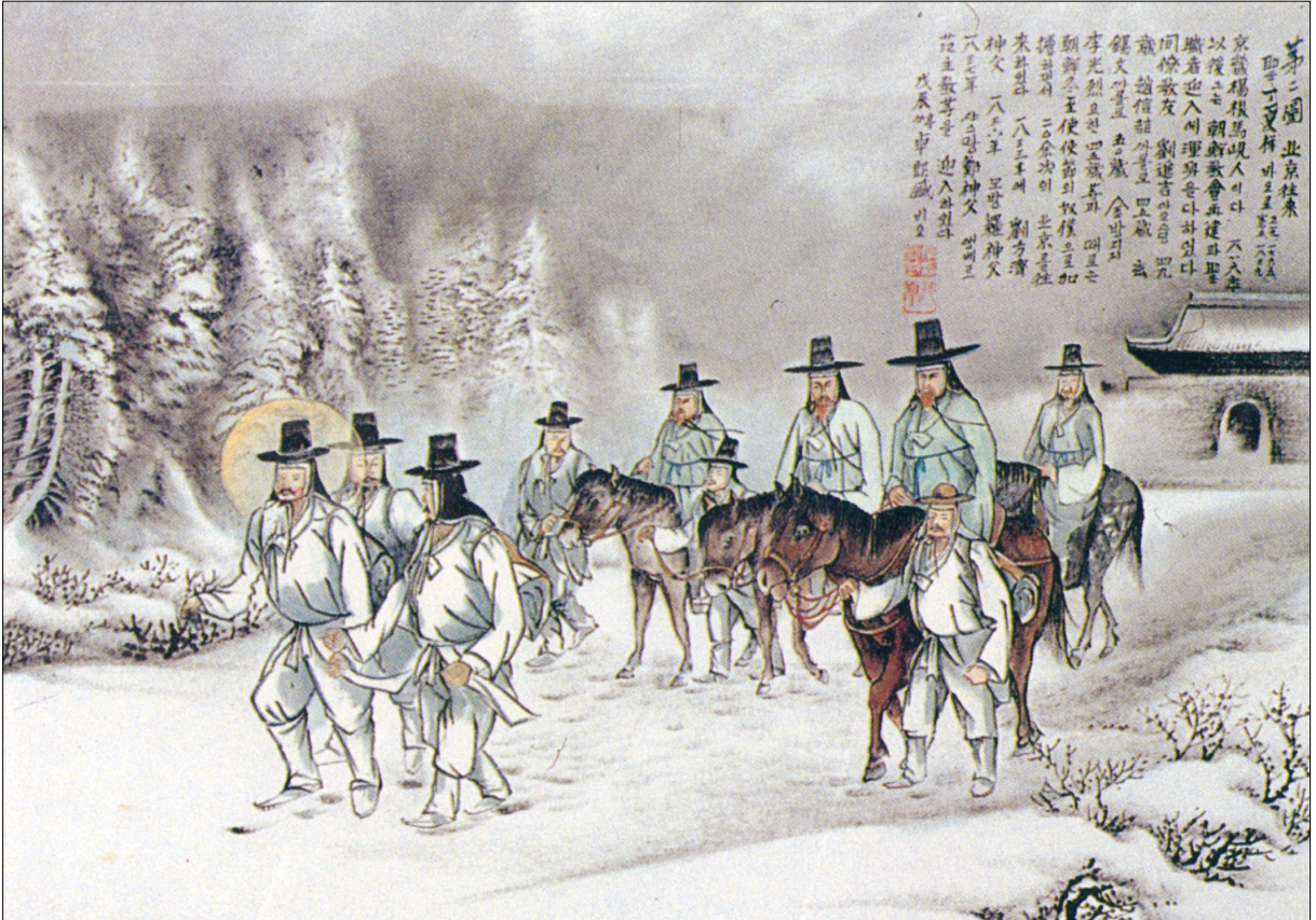
그림 | 탁희성 비오·글 | 김옥희 안나 수녀

발행인 | 이병호 편집 | 전주교 전주교구 홍보국 제 2095호 http://j catholic.or.kr E-mail | catholic114@hanmail.net 주소 | 560-110 전주시 완산구 기린대로 100번지 전화 | (063)230-1004 팩스 | (063)230-1175