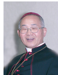
이병호 빈첸시오 주교 (전주교구장)

산과 들의 모든 생명이 죽은 듯한 겨울입니다. 눈이 있어도 아무 소용이 없을 것 같은 밤입니다. 겨울에 생명으로 오시는 분. 밤중에 빛으로 오시는 님.