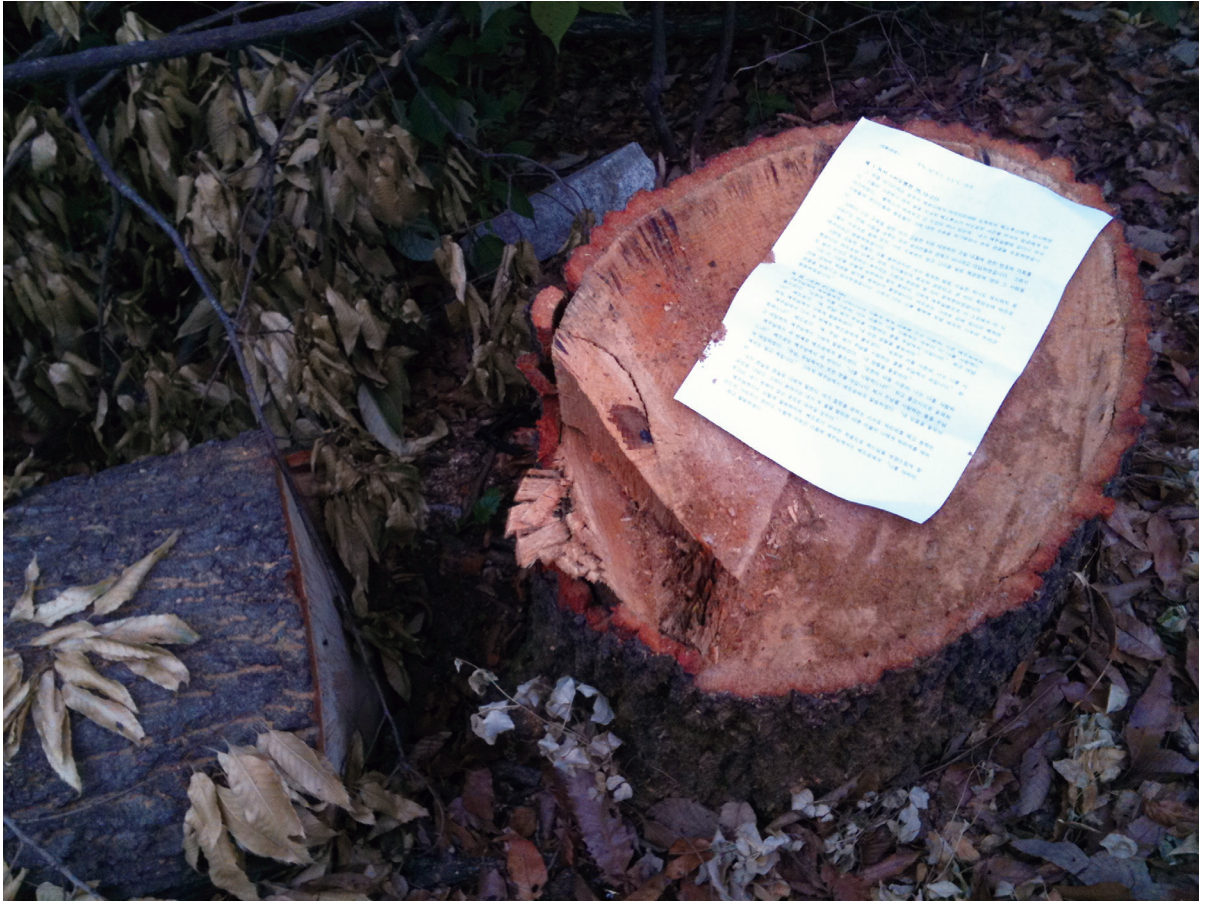
사진 | 이병호 빈첸시오 주교

발행인 | 이병호 편집 | 천주교 전주교구 홍보국 제2215호 http://j catholic.or.kr E-mail | catholic14@hanmail.net 주소 | 560-110 전주시 완산구 기린대로 100 전화 | (063)230-1004 팩스 | (063)230-1175