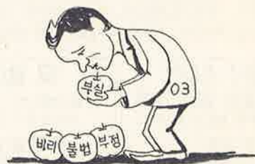
조깅보다 동배운동을 많이 하세요.