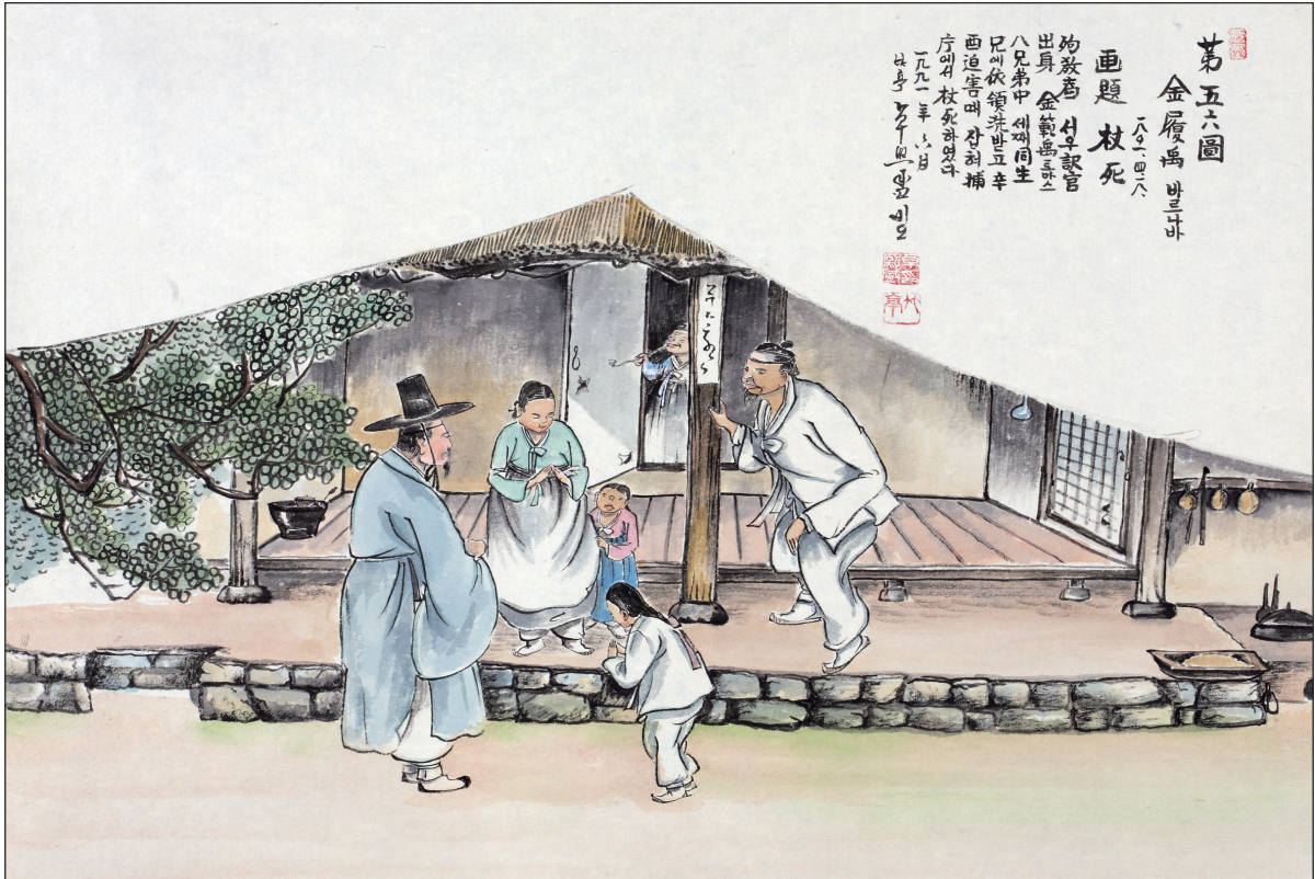
하느님의 종 124위 열전(44) - 김이우 바르나바(?~1801년)

발행인 | 이병호 편집 | 천주교 전주교구 홍보국 제2190호 http://catholic.or.kr E-mail | catholic14@hanmail.net 주소 | 560-110 전주시 완산구 기린대로 100 전화 | (063)230-1004 팩스 | (063)230-1175