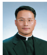
길성환 베드로 신부 (치명자산 성지)

그렇다. 현재 대한민국의 대통령은 자신의 힘으로는 스스로 이 도덕적 책임의 치매 현상으로 인한 정치적 부패에서 벗어나기 어렵다. 그러므로 그에게는 진정한 예언자와 백성들의 연민과 사랑이 가득한 기도가 필요하다. “아버지의 나라가 오게 하시며, 아버지의 뜻이 하늘에서와 같이 땅에서도 이루어지게 하소서!”(마태 6,10) 마지막으로 대통령과 우리 자신 모두가 책임과 국가개조의 시작임을 망각하게 되는 또 다른 치매의 뒷에 걸리지 않도록 성령의 힘을 청한다.