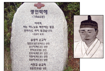
-전주 숲정이 성지 병인박해 순교자 이름을 새긴 바-

아내를 위로 / 혼인한지 얼마 되지 않아 체포된 성인은 차마 떨어지지 않는 발길을 떼어 놓으며 아내를 위로하였다.