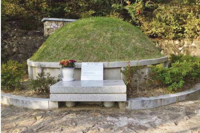
▲ 유항검 가족 합장묘