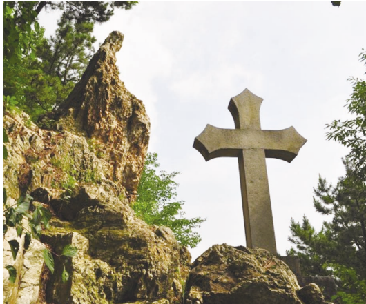
▲ 성모님 모습 바위

취재 말미에 김봉희 신부님은 “한편으로는 다른 성지들보다 더 개발하지 않은 것이 아쉽기는 하지만, 다른 한편으로는 자연 그대로 놔 둔 것이 시간이 지나고보니 더 잘 된 것