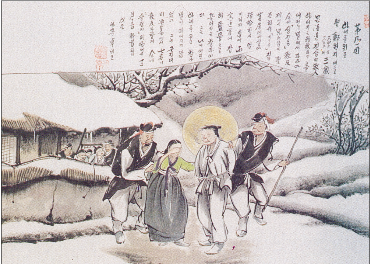
그림 | 탁희성 비오 작

발행인 | 이병호 편집 | 천주교 전주교구 홍보국 제 2063호 http://j catholic.or.kr E-mail | catholic114@hanmail.net 주소 | 560-110 전주시 완산구 기린대로 100번지 전화 | (063)230-1004 팩스 | (063)230-1175