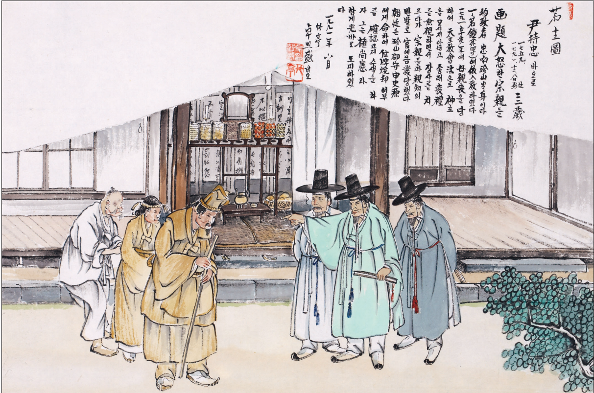
하느님의 종 124위 열전(1) - 윤지충 바오로(1759-1791)