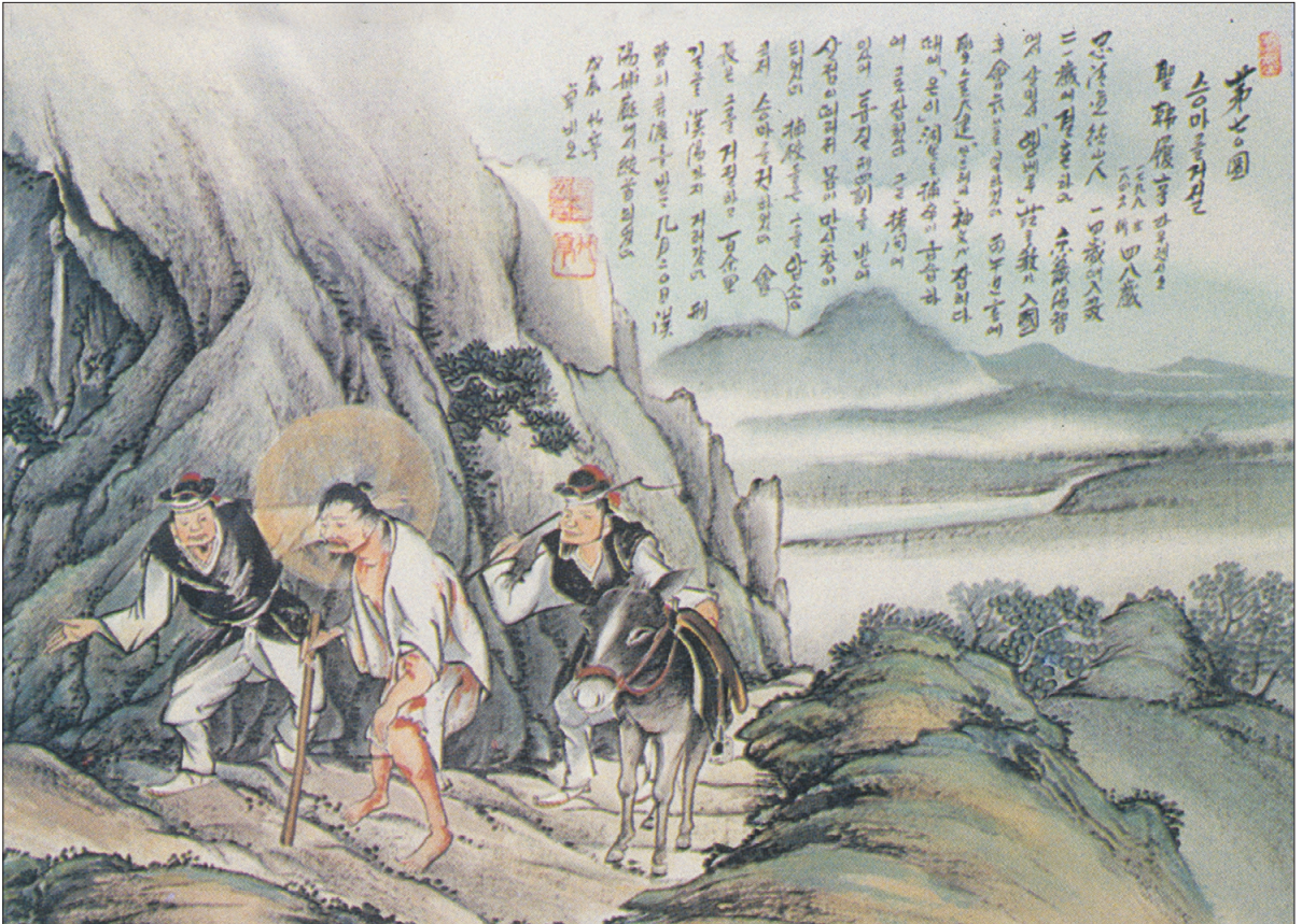
그림 | 탁희성 비오·글 | 김옥희 만나 수녀

승마를 거절 / 한이형 성인은 양지 은이마을에서 체포될 때 포졸들에게 몹시 얻어맞아 차마 볼수 없게 되었다. 포졸이 말을 타고 서울까지 가자고 권했으나 그리스도의 고난을 생각하고 거절하여 맨발로 서울까지 갔다.