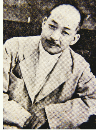
故 김영구 베드로 신부

온 첫 순교자 윤지충 바오로에 대한 집중조명, 순교자들에게 가해졌던 형벌, 12년 동안 옥에 갇힌 채 혹독한 형벌을 견딘 신태보 순교자의 감동적인 이야기를 담았습니다.