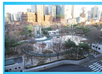
◀ 홍교만 프란치스코 하비에르가 교한 서울 서소문성지.

홍교만은 한양에서 태어났다. 1801년 신유박해 때 순교한 홍인 레오는 아들이고, 정철상 가톨릭 사위이다. 아들 홍인으로부터 교리를 자세히 들은 뒤 입교하였으며 주문모 신부한테 세례를 받고 냉담자 회도와 교리 전파에 열중하였다. 1801년 신유박해 때 사돈 정약종의 책 상자를 집에 숨겨 두었다 옮기는 과정에서 발각돼 피신했으나 얼마 안돼 체포되었다. 그해 2월 14일 의금부로 압송되어 문초와 형벌