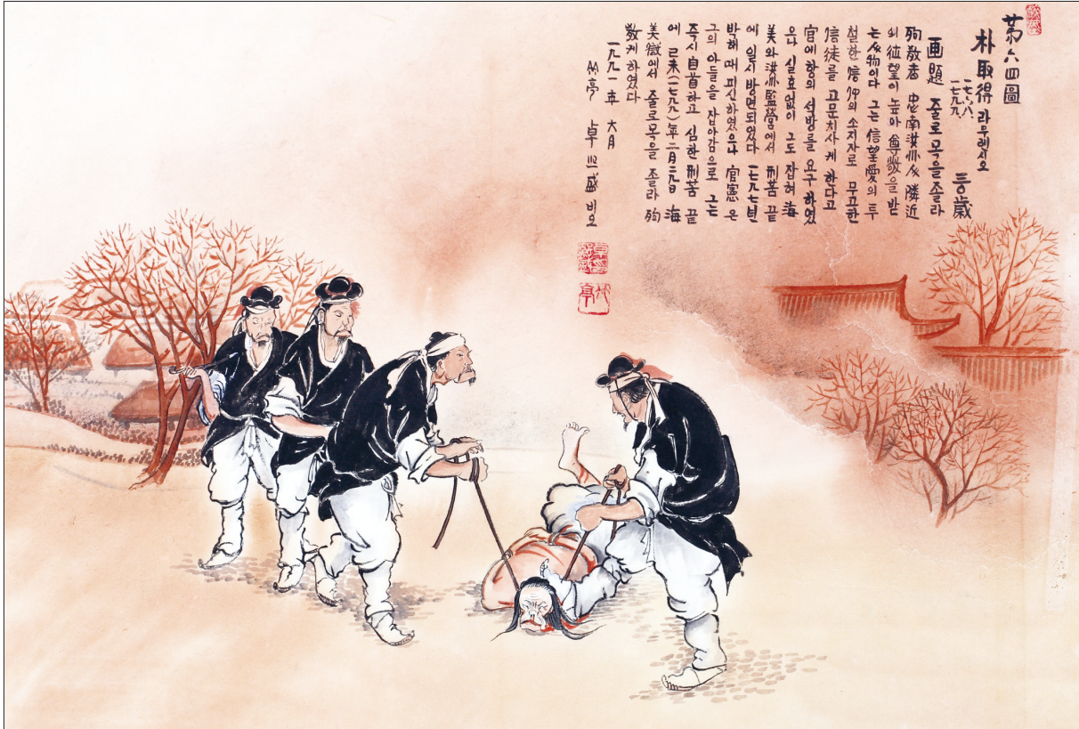
하느님의 종 124위 열전(10) - 박취득 라우렌시오(?~1799년)

발행인 | 이병호 편집 | 천주교 전주교구 홍보국 제2147호 http://j catholic.or.kr E-mail | catholic14@hanmail.net 주소 | 560-110 전주시 완산구 기린대로 100번지 전화 | (063)230-1004 팩스 | (063)230-1175