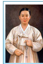
◀어농성지에 있는 순교자 강완숙 골롬바 초상화

1761년 충청도 내포 지방에서 태어난 강완숙은 덕산에 살던 흥지영의 후처로 들어간 후 천주교 신앙에 대해 듣고 책을 얻어 읽는 가운데 그 신앙의 위대함을 깨닫게 됐다. 이후 강완숙은 신앙에 대한 열정과 극기를 바탕으로 교리를 실천해 나갔고 시어머니와 아들 필주(필립보)에게 교리를 가르쳐 입교시켰다. 신앙 때문에 남편으로부터 시달림을 받아야 했던 골롬바는 시어머니와 아들과 함께 한양으로 이주해 살면서 주 신부가 입국하자 세례를 받았다. 그녀의 인품을 안 주 신부는 강완숙을 여회장으로 임명하여 신자들을 돌보도록 하였다. 1795년 을묘박해가 일어나자 자기 집을 주 신부 피신처로 내