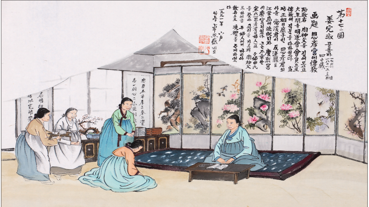
하느님의 종 124위 열전(34) - 강완숙 골롬바(1761~1801년)

발행인 | 이병호 편집 | 천주교 전주교구 홍보국 제2176호 http://j catholic.or.kr E-mail | catholic14@hanmail.net 주소 | 560-110 전주시 완산구 기린대로 100 전화 | (063)230-1004 팩스 | (063)230-1175