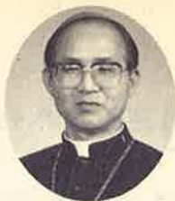
천주교 전주교구장 이병호 주교

참된 성장의 도구가 됩니다. 첫 아담은 자신의 실제 처지보다 더 올라서려하다가 결국 파멸에 이르렀는데 반하여, 둘째 아담이신 예수 그리스도께서는 자신의 본래 지위마저 버리고 인간의 약함, 그 가운데서도 십자가 처형이라는 극도로 무거운 처지를 받아들임으로써 우리에게 구원을 베풀어주셨습니다.