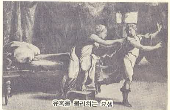
유혹을 물리치는 요셉

주인 아내는 자신의 구애가 실패로 돌아가자 요셉을 궁지에 빠뜨리는데 혈안이 되었다. 요셉을 ‘저 히브리 녀석’이라고 부르는데 이것은 이스라엘 사람들을 경멸조로 부를 때 사용하는 용어이다. 부인은 여기서 그치지 않고 내친 김에 요셉의 옷을 챙겨 두었다가 주인이 오기를 기다려 요셉을 또다시 증상모략한다. 그리고 부인은 이 모든 사태의 책임을