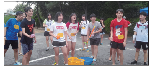
▲송학동 성당 중고등부 스카우트 활동