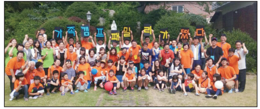
▲오촌 성당 가족 캠프