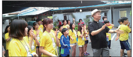
▲우림 성당 초등부 여름 신앙학교