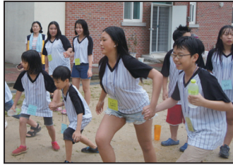
▲화산동 성당 여름 캠프