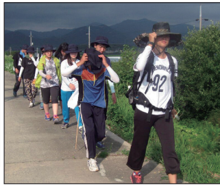
▲고산 성당 본당 설립 120주년 기념 도보 순례