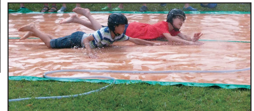
▲우전 성당 초등부 여름 캠프

*4-5면 본문기사는 요약된것이니 원문은 전주교구 홈페이지에서 확인할 수 있습니다.