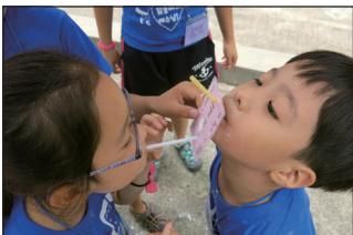
▲용머리 성당 초등부 여름 캠프