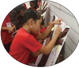
▲중산 성당 성경말씀과 함께하는 캠프