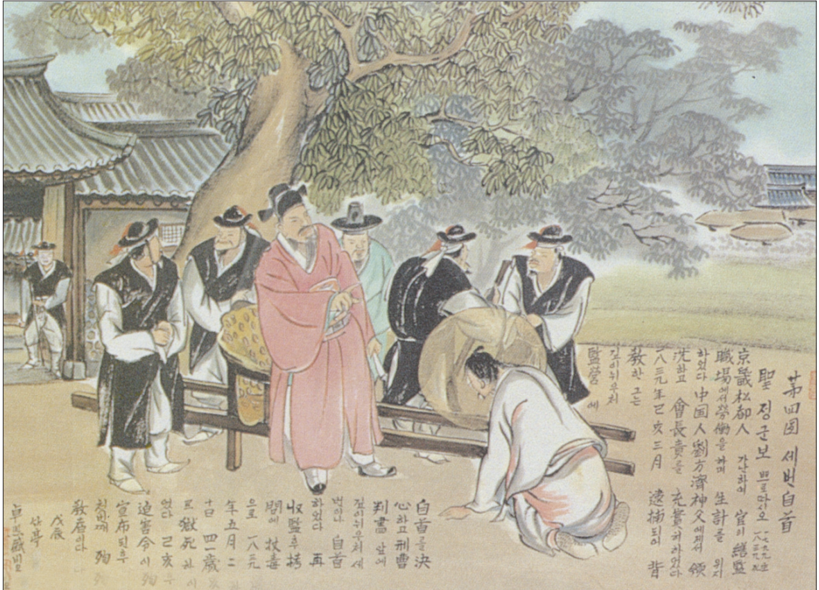
그림 | 탁희성 비오 · 글 | 김옥희 안나 수녀

발행인 | 이병호 편집 | 천주교 전주교구 홍보국 제 2118호 http://j catholic.or.kr E-mail | catholic114@hanmail.net 주소 | 560-110 전주시 완산구 기린대로 100번지 전화 | (063)230-1004 팩스 | (063)230-1175