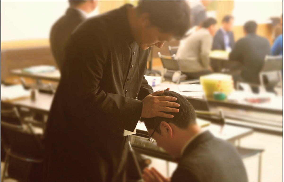
13기 아버지학교 실천과정 봉사자 축복기도 장면. (2014. 11. 16)