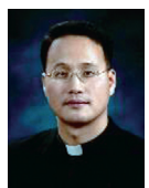
길성환 베드로 신부 (치명자산 성지)

그렇다. 우리 교회는 인격의 상호 존중과 인간의 존엄성이 어떤 표현의 자유보다도, 모든 권위주의에 대한 비판에 대한 테러보다도 앞선다는 것이 가장 중요함을 언제나 강조하고 있는 것이다. 정말 이번 테러를 접하면서 우리 그리스도인이 숙고해야 할 부분은 "보호해야 할 표현의 자유일까? 도를 넘은 지나친 이슬람의 비하일까? 아니면 인간 생명의 존엄성일까?"이다.