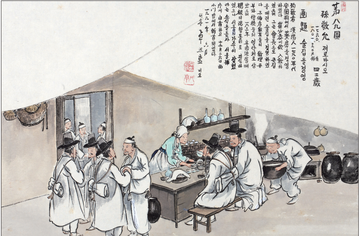
복자 124위 열전 - 손경윤 제르바시오(1760-1802)