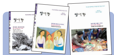
살며살 구독문의 : 230-1166

작은자매의집 직원모집 분야:생활재활교사 3명, 작업치료사 1명, 언어치료사 1명, 상담평가요원 1명, 촉탁의사 1명