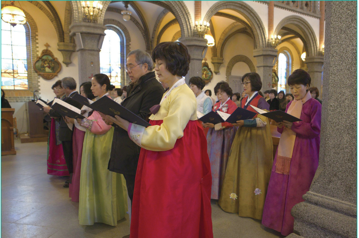
교리교사 및 말씀의 봉사자 파견미사(2015. 1. 20)