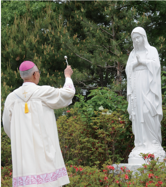
전주교 전주교구청 성모상 축복식 5월 6일(수) 교구청에 성모상을 모시는 뜻깊은 시간을 가졌다. | 홍보국 |

서일 성당 성모신심 특강 및 성모의 밤 행사 서일 성당(주임=성태수 신부)은 5월 4일(월) 저녁 7시 30분부터 성모 성월을 맞아 신자들의 신앙심을 고취시키기 위해 박상운(여산 성당 주임) 신부를 초청하여 성모신심 특강을 실시했다. 박상운 신부는 “우리는 이미 성령을 받은 사람들이다. 내 안에 들어오신 성령의 힘으로 어떠한 어려움과 고통이라도 잘 이겨낼 수 있는 신앙인의 삶을 살자”고 강조했다. 또한 5월 7일(목) 저녁 7시 30분에 성모의 밤 행사를 했다. 김대식 기자