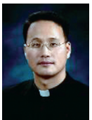
길성환 베드로 신부 (치명자산 성지)

우리가 잘 알고 있듯이 유럽에서 유대인의 대학살 기간은 하느님과 인류에 대한 상상조차 할 수 없는 범죄로 얼룩진 참으로 어두운 역사의 밤(교황 요한 바오로 2세, Regina Coeli에서 한 연설, 3항)이었다. 대한민국이 속한 아시아에서도 그러한 평화의 실패가 똑같이 있었다. 이런 상황에 대한 우리 가톨릭 교회는 전쟁은 “진정한 모든 인도주의 실패”이며, “언제나 인류에게 좌절을 안겨 주는 것”이라고 강조한다(간추린 사회교리, 497항). 그리고 전쟁을 통해 “민족, 인종, 종교 또는 언어 집단 전체를 말살하려는 시도는 하느님과 인류 전체에 대한 범죄이며, 그러한 범죄의 책임자들은 정의 앞에서 그에 대한 벌을 받아야 한다(간추린 사회교리, 506항)”고까지 말한다. 그러나 가톨릭 교회는 무엇보다도 진정한 평화는 오로지 용서와 화해를 통해서만 가능하다고 가르친다. 왜냐하면 전쟁의 고통은 오로지 전쟁 당사자 모두의 깊고 진실하며 용기 있는 반성, 참회로 깨끗해진 마음가짐으로 현재의 어려움에 맞설 수 있는 반성을 통해서만 없어질 수 있기 때문이다(간추린 사회교리, 518항).