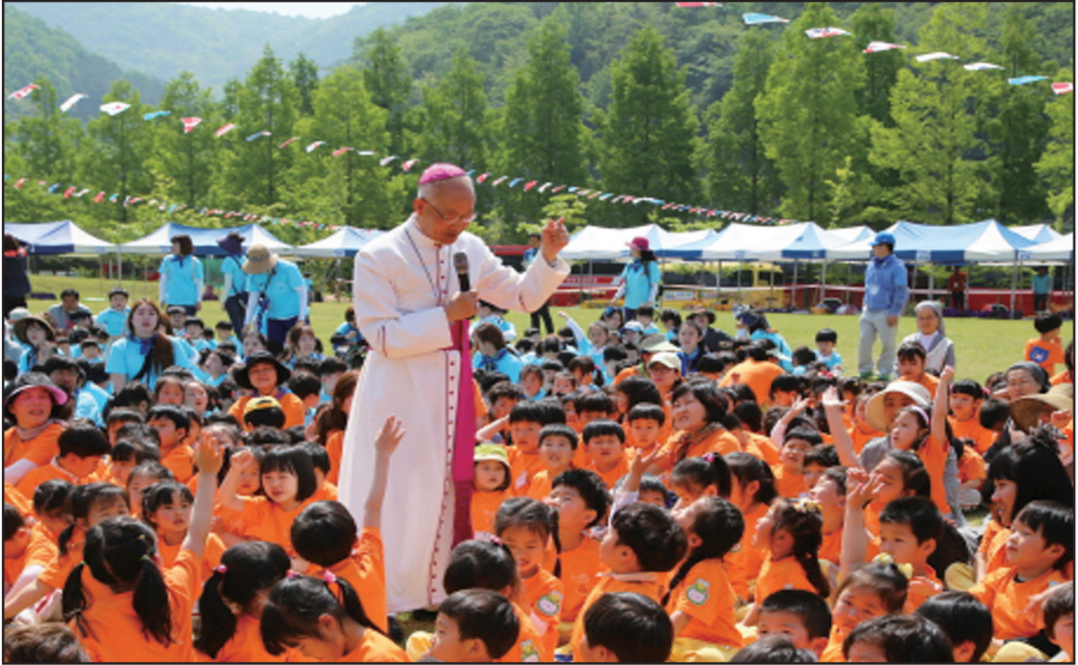
전주교구 유치원, 어린이집 연합체육대회(2015. 5. 7)