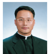
길성환 베드로 신부 (치명자산 성지)

또한 우리 모두는 각자 자기 자리에서 다른 사람을 위한 일을 하는 정치인들이다. 우리 자신은 누군가에게 삶의 방향을 가르쳐 주고, 정작 그 길을 가지 못하는 길거리의 장승이 되지 않기를 기도해 본다.