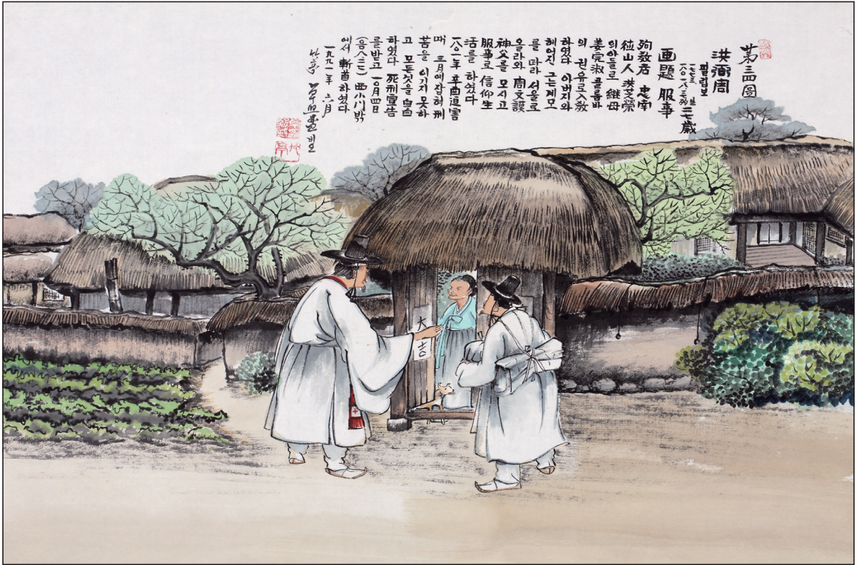
복자 124위 열전 - 홍필주 필립보(1774-1801)