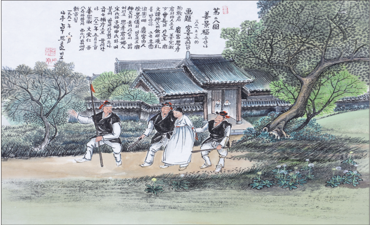
하느님의 종 124위 열전(35) - 강경복 수산나(1762~1801)

발행인 | 이병호 편집 | 천주교 전주교구 홍보국 제2177호 http://j catholic.or.kr E-mail | catholic14@hanmail.net 주소 | 560-110 전주시 완산구 기린대로 100 전화 | (063)230-1004 팩스 | (063)230-1175