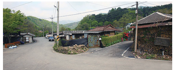
윤지현 가족이 피란하던 교회 창립 초기의 교우촌인 운주면 저구리 일대