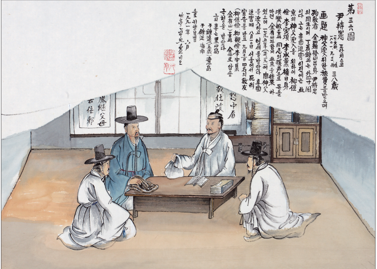
그림 | 탁희성 비오 작

발행인 | 이병호 편집 | 전주교 전주교구 홍보국 제 2070호 http://jccatholic.or.kr E-mail | catholic114@hanmail.net 주소 | 560-110 전주시 완산구 기린대로 100번지 전화 | (063)230-1004 팩스 | (063)230-1175