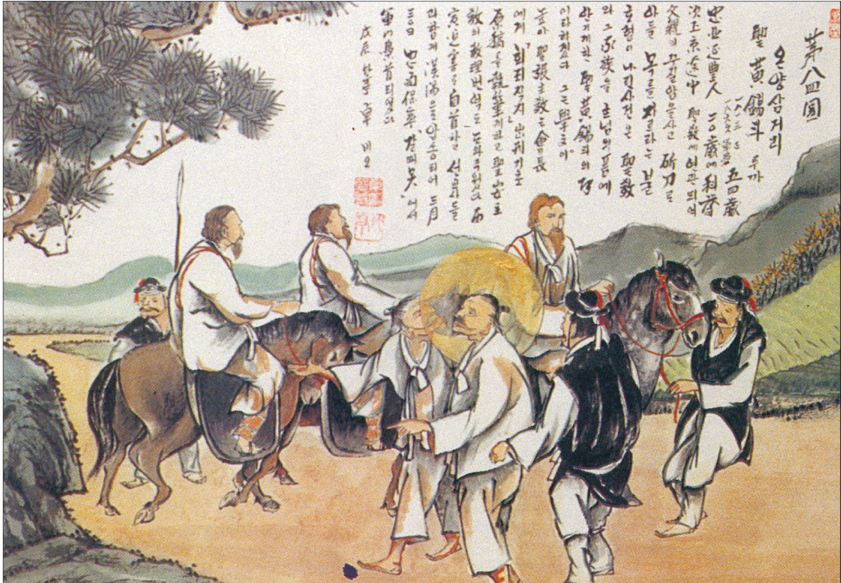
그림 | 탁희성 비오·글 | 김옥희 안나 수녀

발행인 | 이병호 편집 | 전주교 전주교구 홍보국 제2132호 http://j catholic.or.kr E-mail | catholic14@hanmail.net 주소 | 560-110 전주시 완산구 기린대로 100번지 전화 | (063)230-1004 팩스 | (063)230-1175