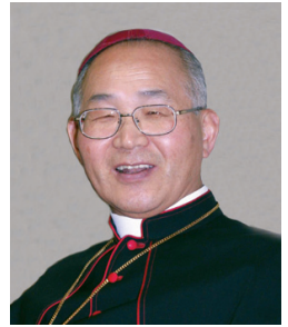
이병호 빈첸시오 주교 전주교구장

그렇게 하면 우리 모두가 사도가 되어 주님의 당부를 실천할 수 있게 될 것입니다. “나는 하늘과 땅의 모든 권한을 받았다. 그러므로 너희는 가서 이 세상 모든 사람들을 내 제자로 삼아 아버지와 아들과 성령의 이름으로 그들에게 세례를 베풀고 내가 너희에게 명한 모든 것을 지키도록 가르쳐라. 내가 세상 끝까지 항상 너희와 함께 있겠다”(마태 28,18-20).