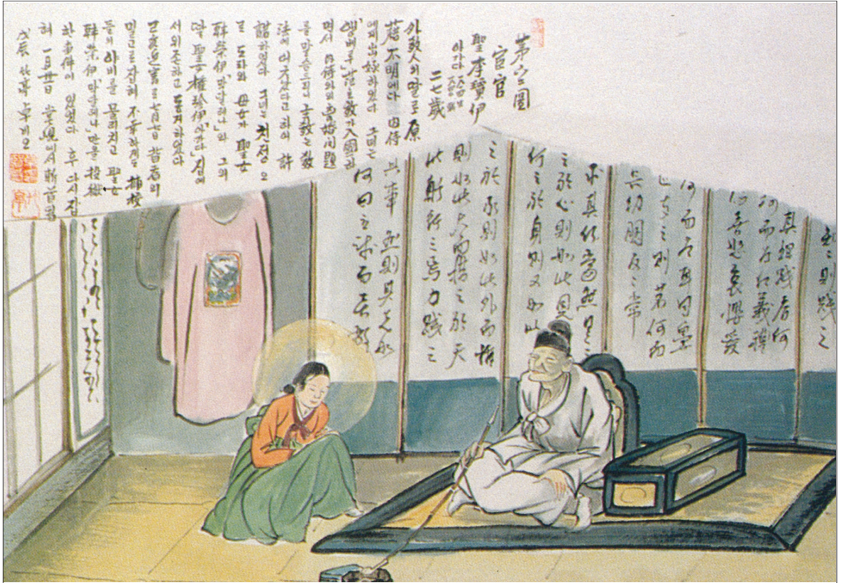
그림 | 탁희성 비오 · 글 | 김옥희 만나 수녀

환관에게 시집감 / 이경이 성녀는 환관에게 출가하였으나 이혼하고 친정으로 돌아와 열심히 신앙생활을 하다가 체포되었다.