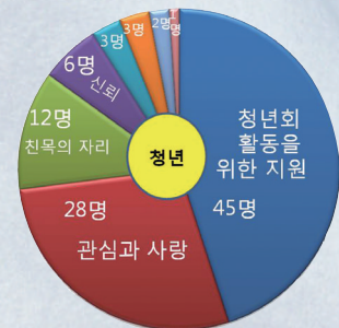
나는 사목회에 ( )를 바란다!