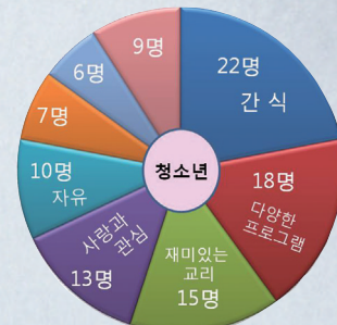
나는 교리교사에게 ( )를 바란다!