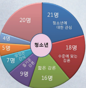
나는 신부님께 ( )를 바란다!