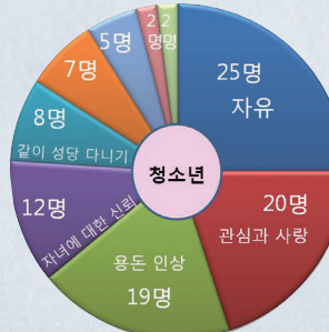
나는 부모님께 ( )를 바란다!