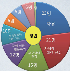
나는 부모님께 ( )를 바란다!