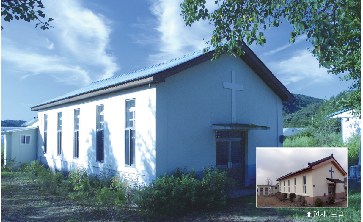
↑ 현재 모습

발행인 | 이병호 편집 | 천주교 전주교구 홍보국 제 2040호 http://j catholic.or.kr E-mail | catholic114@hanmail.net 주소 | 560-110 전주시 완산구 남노송동 78-3 전화 | (063)230-1004 팩스 | (063)230-1175