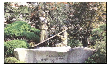
<전동성당에 있는 윤지충·권상연 동상>

크게 노한 종친들 / 윤지충이 모친상을 당했을 때 유교식 제사 대신 전주교 예절로 장례를 치른 것을 안 종친들이 크게 화를 내고 있다.