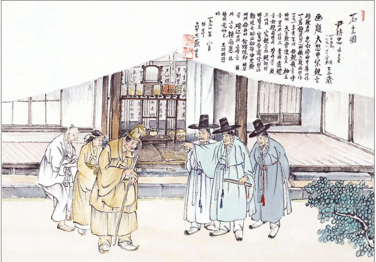
그림 | 탁희성 비오 작

발행인 | 이병호 편집 | 전주교 전주교구 홍보국 제 2065호 http://j catholic.or.kr E-mail | catholic114@hanmail.net 주소 | 560-110 전주시 완산구 기린대로 100번지 전화 | (063)230-1004 팩스 | (063)230-1175