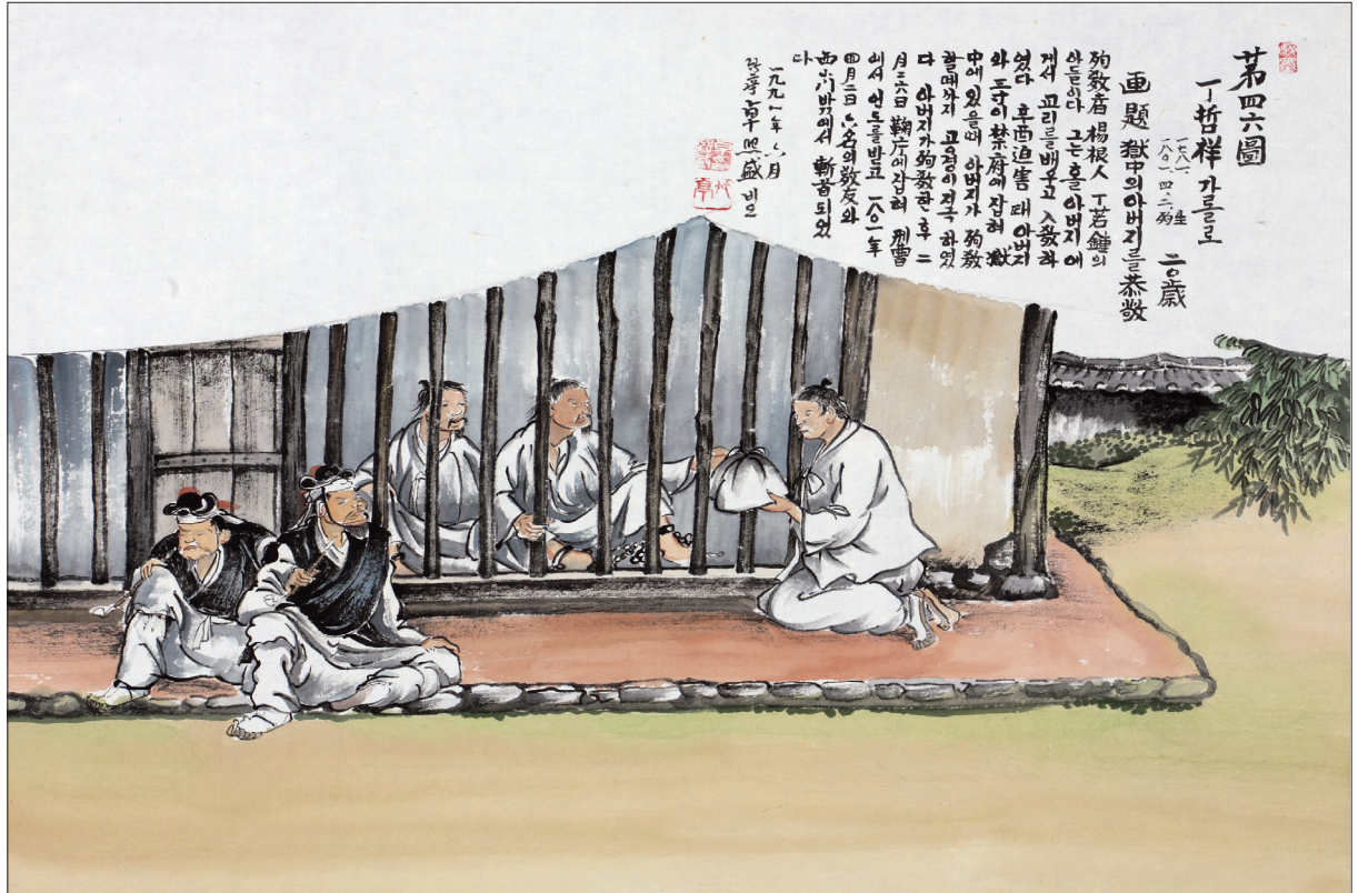
하느님의 종 124위 열전(32) - 정철상 가롤로(?-1801년)