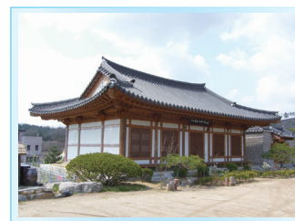
◀마재성지 한옥 성당 현재 경기도 남양주시 조안면 능내리에 위치

옥중 아버지를 공경 / 아버지 정약종과 숙부들이 옥에 감히자 정철상 가롤로가 옥바라지를 하고 있다.