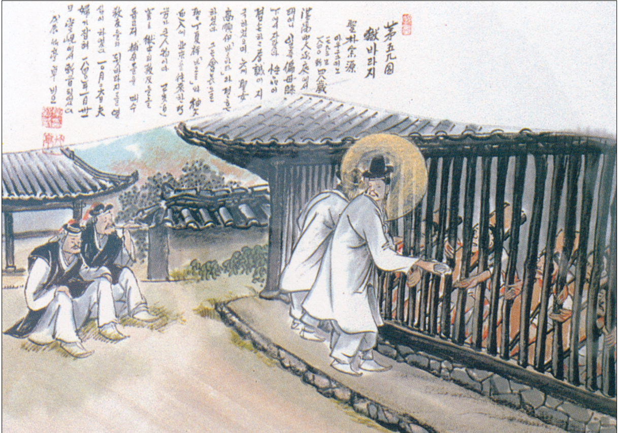
그림 | 탁희성 비오 · 글 | 김옥희 안나 수녀

발행인 | 이병호 편집 | 천주교 전주교구 홍보국 제 2094호 http://j catholic.or.kr E-mail | catholic114@hanmail.net 주소 | 560-110 전주시 완산구 기린대로 100번지 전화 | (063)230-1004 팩스 | (063)230-1175