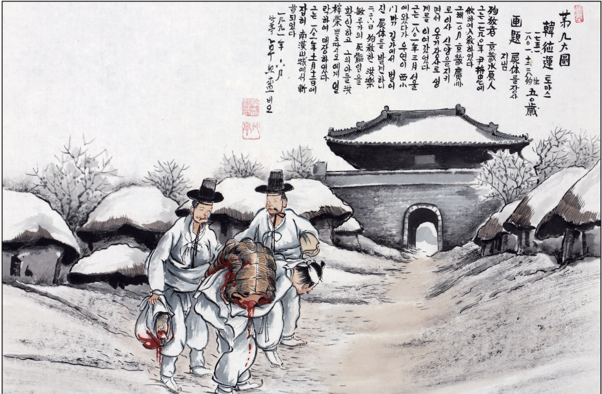
복자 124위 열전 - 한덕운 토마스 (1752~1802)

발행인 | 이병호 편집 | 전주교 전주교구 홍보국 제2211호 http://catholic.or.kr E-mail | catholic14@hanmail.net 주소 | 560-110 전주시 완산구 기린대로 100 전화 | (063)230-1004 팩스 | (063)230-1175