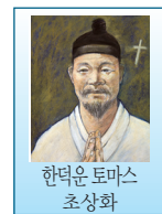
한덕운 토마스 초상화

충청도 흥주 출신인 한덕운 토마스는 1790년 10월 윤지충 바오로에게 교리를 배워 입교했다. 이듬해에 윤지충은 신해박해로 순교했지만, 한덕운은 비밀리에 신앙생활을 하며 열심히 교리를 실천했다. 1800년 10월, 한덕운은 좀 더 자유로운 신앙생활을 위해 고향을 떠나 경기도 광주 땅에 속한 의일리(현 경기도 의왕시 학의동)로 이주했다. 이곳에서 그는 성실하게 생활하면서 오로지 하느님 뜻을 따르는 데만 열중했다. 그는 신자들을 모아 놓고 가르치고 권면하기를 좋아했다. 이듬해 초 신유박해가 일어나자 교회와 교우들