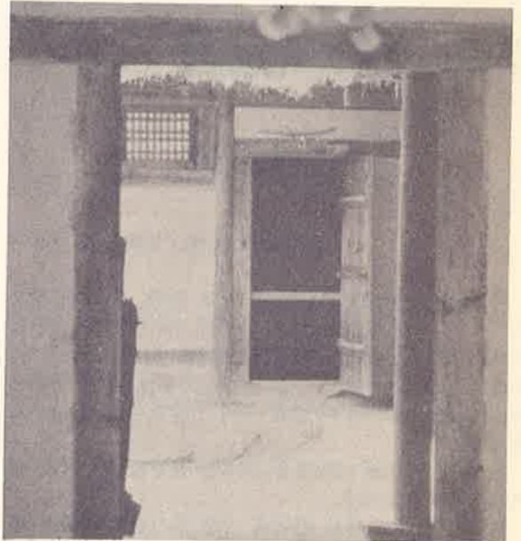
주여, 언제 오시렵니까.

대림 제 4주간의 전례는 본기도에서 주님의 탄생을 기뻐하고, 예수 성탄을 준비하는 사건들을 상기시킴으로 예수 성탄을 잘 맞이하도록 이끈다. 말하자면 주의 첫