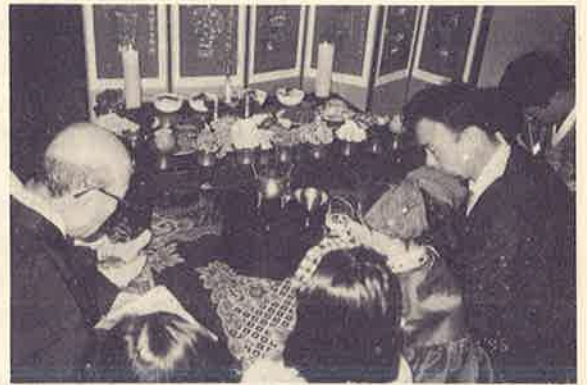
이기 때문에 '부모를 공경하라'는 계명과 연관시켜 생각하면 좀더 여유있게 지낼 수 있을 것이다.

결국, 제사의 참된 의미를 고려해 볼 때 제사문제는 이교나 미신행위가 아니라 자신의 근본을 찾고 부모와 조상에게 효도를 다하는 하나의 생활관습