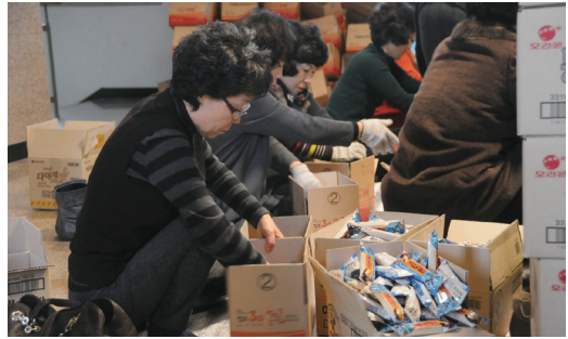
교구 군중후원회 군장병 신자들을 위한 성탄선물 발송 12월 14일(월) 교구청

중심으로 열심히 갈고 닦은 결실을 그림으로 표현한 성경그림 전시회가 12월 13일(주일) 소성당에서 있었다. 이번 전시회는 '새로나는 성경공부 <성인편>'과 '루카