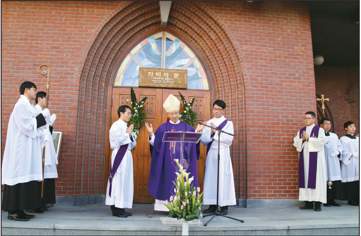
자비의 특별히년 성문 개문 미사(2015. 12. 13 중양성당)

2016년 교구장 사목교서 - 너희의 아버지께서 자비로우신 것같이 너희도 자비로운 사람이 되어라.