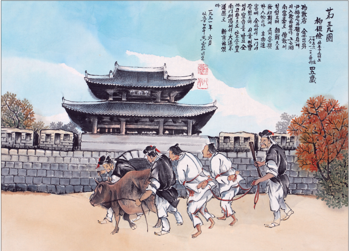
그림 | 탁희성 비오 작

발행인 | 이병호 편집 | 전주교 전주교구 홍보국 제 2069호 http://j catholic.or.kr E-mail | catholic114@hanmail.net 주소 | 560-110 전주시 완산구 기린대로 100번지 전화 | (063)230-1004 팩스 | (063)230-1175